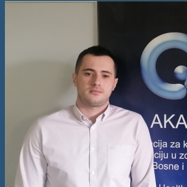
2. Indikatori za apoteke Eldar Vuković. ba. ecc.