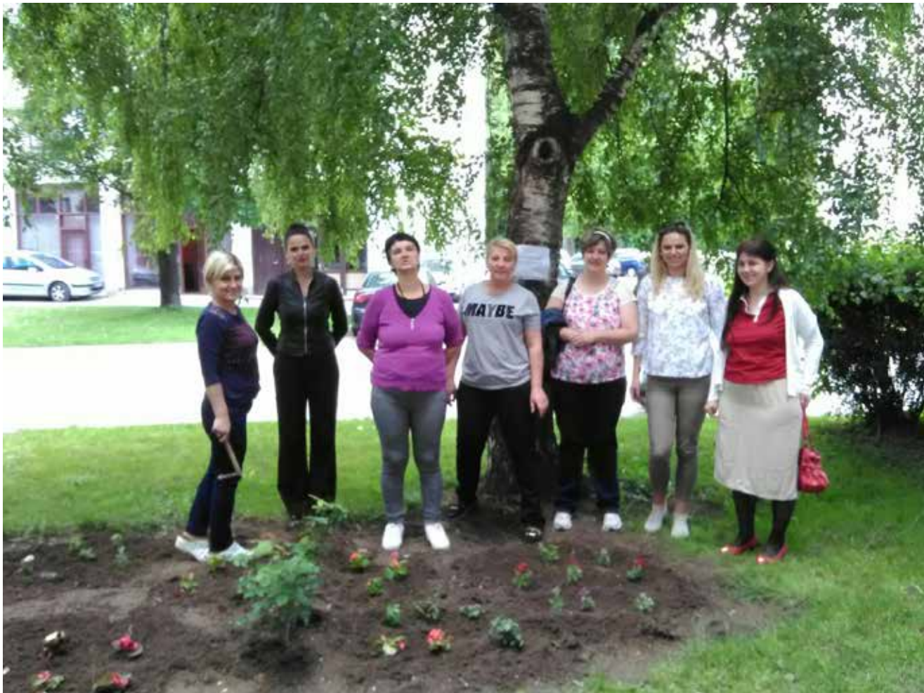
Resocijalizacija kao prioritet: Od Komunalnog preduzeća dobili površinu na kojoj sade i uzgajaju cvijeće.

koje prodajemo i od toga nabavljamo novi materijal", kaže Silva.