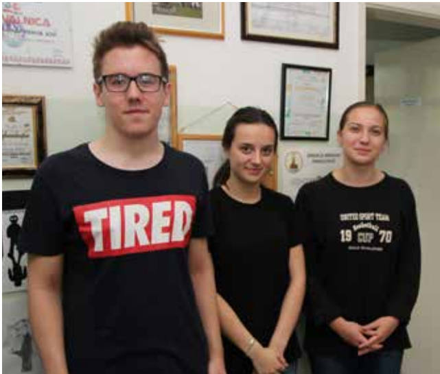
Grupa srednjoškolaca je 2015. i 2016. u CMZ Ključ dobila potrebnu pomoć za realizaciju projekta

„Rad Centra traje 24 sata, ovo nije radno mjesto već profesija. Danas je najteže razviti empatiju, a empatija je zlatni standard mentalnog zdravlja“, dodaje doktor Behzad.